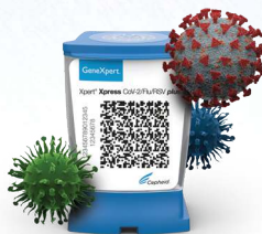
Xpert ® Xpress CoV-2/Flu/RSV plus 36 minutes