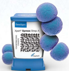
Xpert ® Xpress Strep A 24 minutes

L'offre groupée des tests pour affronter l'hiver