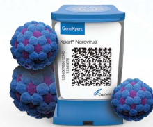
Xpert ® Norovirus 60 minutes*

Besoin d'aide pour préparer la saison hivernale. Scanner le QR Code.